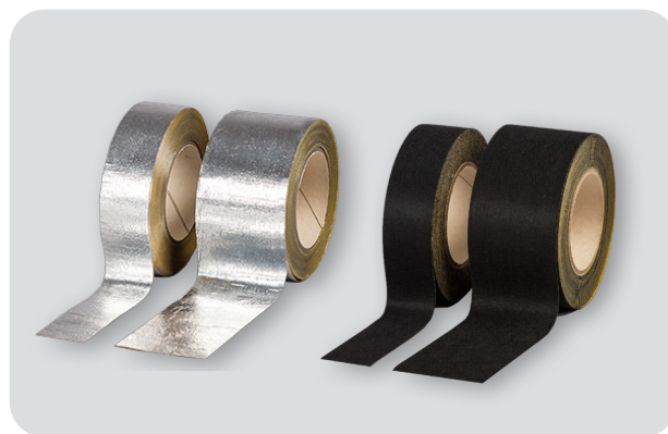
soni ALU-01 und soni VLC-01